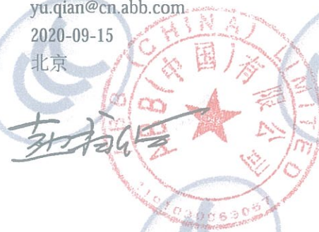
ABB Oy Smart Power P.O.Box 622 FI-65101 VAASA FINLAND

注: 有关本声明信息真伪可登录全国认证认可信息公共服务平台 (cx.cnca.cn) 或扫描右上角二维码查询。